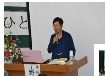
上野千鶴子さんの講演会